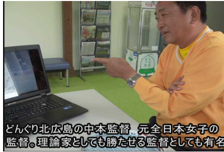
どんぐり北広島の中本監督、元全日本女子の監督。理論家としても勝たせる監督としても有名

ソフトテニスの集大成のDVDと言えます。打つテニスで実績を残してきた3名将に「打ち勝つテニス」をテーマに取材。活躍する選手たちとともに「速いボール」はどう打つのか？上半身の使い方、下半身の使い方はどうするのか？興味深いのは今までの常識を変える内容なのに、3名の講師は同じことを言っています。「ゆるみ」です。