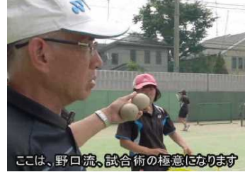
ここは、野口流、試合術の極意になります